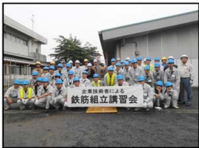
千葉県立東総工業高等学校