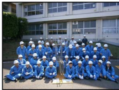
千葉県立京葉工業高等学校